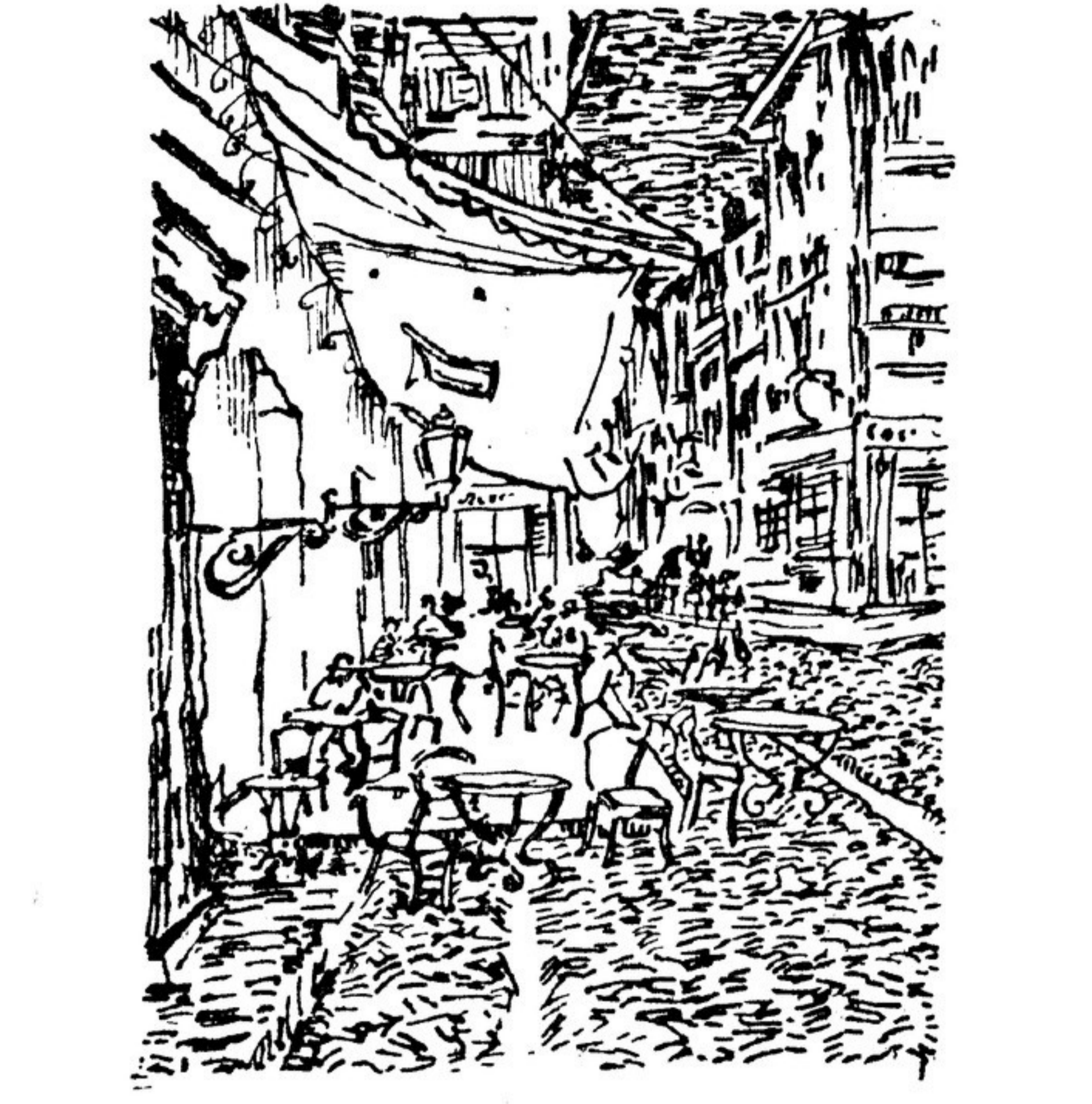
ВАН-ГОГ. Слева рисунок и «Едом на картофели», справа эскиз к картине «Ночное кафе».

От редакции. Редакция считает правильной точку зрения, развиваемую автором данной статьи.