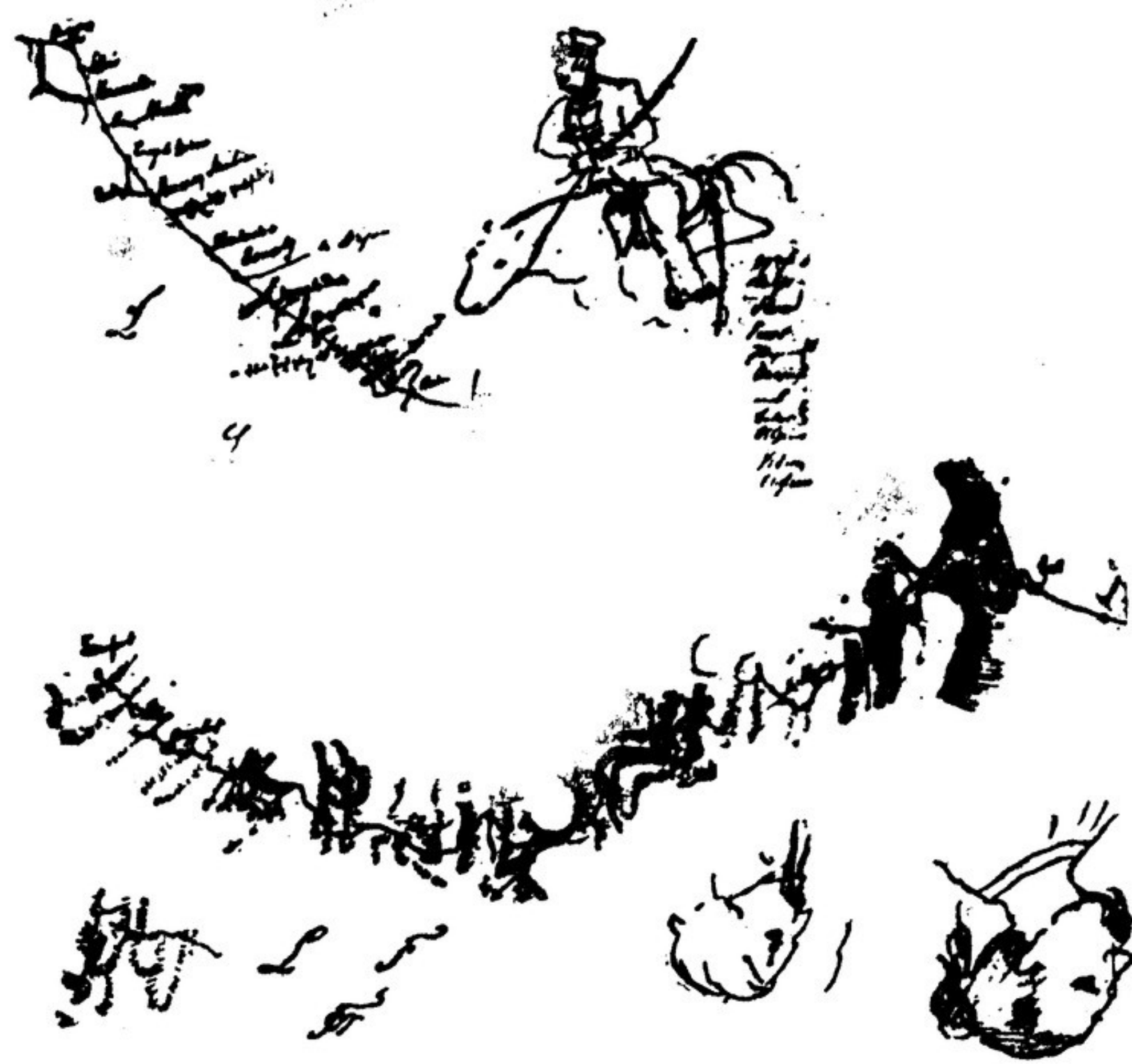
Путевые зарисовки Энгельса (из Парижа в Берн)